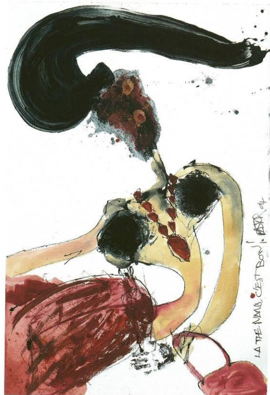
Série Les Salopes « La The Nana c'est bon » - 2004