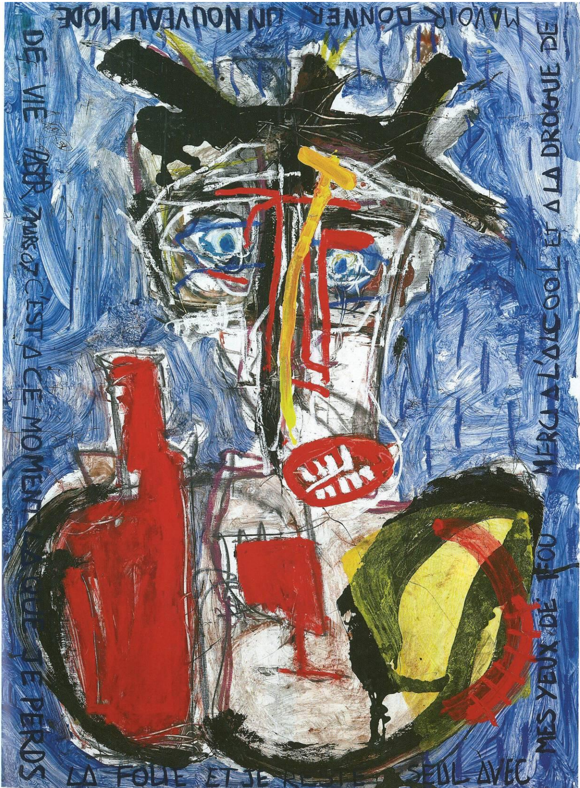
« La Folie » - 2007