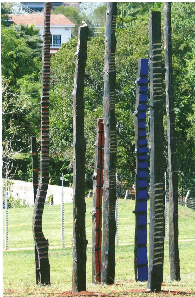
« Les arbres brûlés », United Nations Headquarters in Nairobi, 2006

27, avenue Princesse Grace « Le Formentor » MC 98000 MONACO Tel. +377 92 16 71 17 info@acamonaco.com